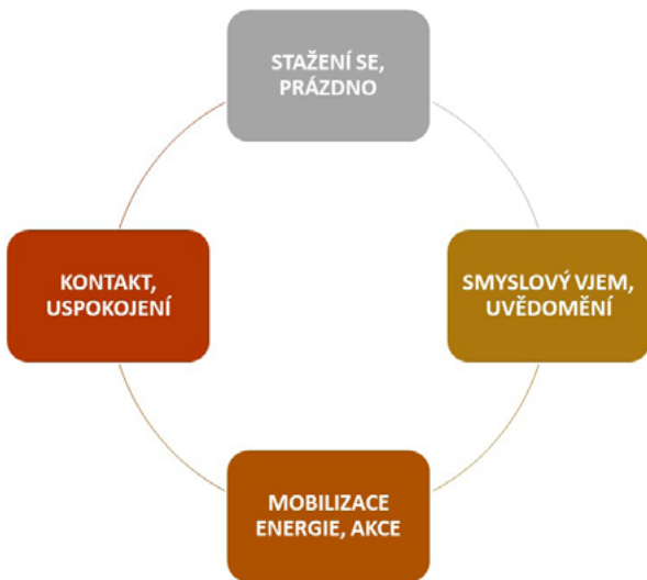
Obr. 1: Kontaktní cyklus podle živlů

Stejný princip funguje i u dlouhodobých projektů. Řekněme, že chcete třeba napsat knihu. Na začátku je stav kreativního prázdna , kdy ještě nemáte konkrétní téma a ani se vám do toho vlastně moc nechce ( země ). I když tahle fáze navenek působí neproduktivně, pro celkový výsledek je důležitá. Zatím neviditelná myšlenka se pomalu formuje.