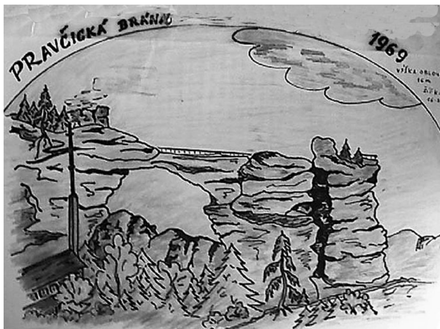
Pravčická brána, Hanisova kresba v Kronice Orlů, rok 1969.