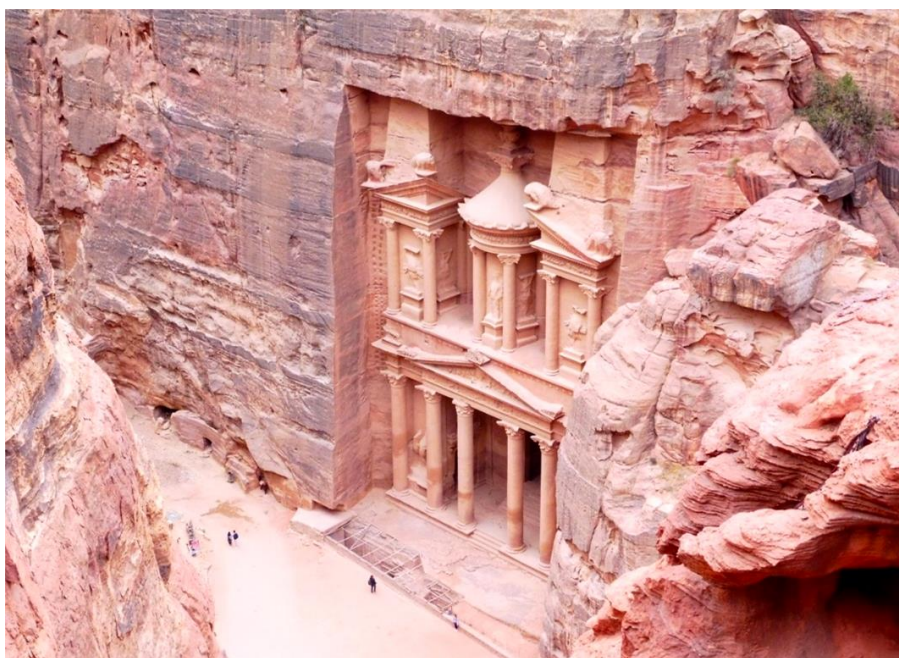
Do Petry vás dopraví ranní autobus z Ammánu. A protože je turistický, jede přímo ke vchodu do areálu.

Alternativou k turistickému autobusu Jett jsou lokální minibusy. Ty odjíždějí z centra Ammánu. Tahle doprava má jeden zádrhel. Neexistuje žádný jízdní řád, jednoduše přijdete, najdete si vozidlo mířící do Petry, zaplatíte, usadíte se a čekáte, až se všechna místa obsadí. Poté se může vyrazit.