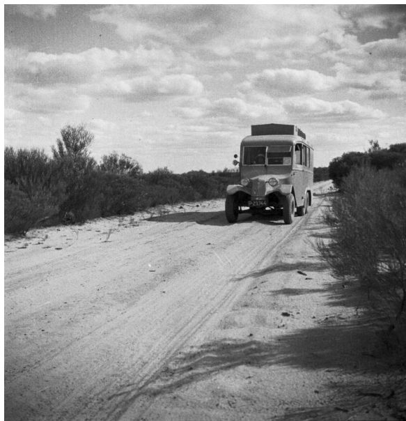
Auto na silnici u Mt. Magnet

Marně hledá oko stopu zeleně - není tu zahrad, až na ubohé náhražky, zaprášené stromky, zasazené do starých plechovek od benzinu. Jen uprostřed Hlavní třídy, která alespoň svojí šířkou může soupeřiti s Václavským náměstím v Praze, je park: napolo uvadlý stromek, uměle udržovaný při životě pečlivě odměřenými dávkami drahocenné vody. Kolem tohoto drahocenného stromu jsou pro pohodlí občanů rozestaveny lavičky.