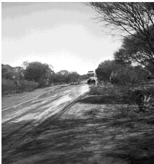
Auto na silnici po dešti u Paynes Find

Pšeničná oblast Západní Austrálie je žlutou páskou, táhnoucí se od severu k jihu, páskou, kterou bílý přistěhovalc položil mezi řídký les pobřežního pásma a vyprahlou poušť vnitrozemí. Dnes se tato oblast bohatých lánů obilí a evropské civilizace povážlivě tenčí – svět ztratil zájem na australské pšenici a farmáři trpí bídou.