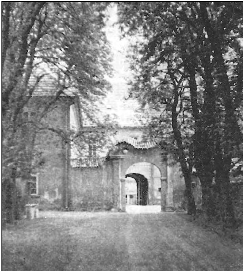
Vchod do záměcku v Králově Dvoře