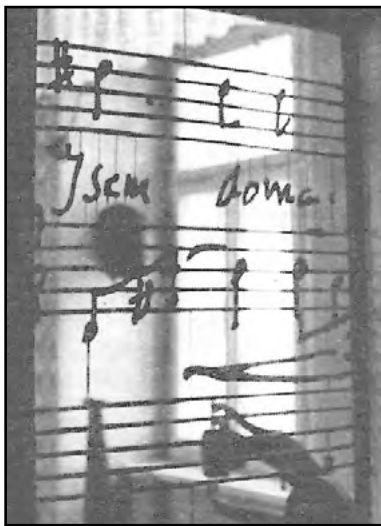
„Jsem doma“ – autograf Bohuslava Martinů v železné mřížce vchodu do světničky, kde strávil prvních 12 let života

Někdy se životní dráhy dvou lidí, z nichž každý se proslavil něčím jiným, diametrálně odlišným, náhle střetávají. Třeba jenom na malý okamžik. Možná se pozdraví, snad se jenom usmějí, možná na sebe pohlédnou – a dost. Nebo ještě méně. Možná jenom náhodně vstoupí do stejného prostoru, ohraničeného zdí, sluncem, jáсотem či ostnatým drátem. Jediné setkání. Zmizí na něj vzpomínka beze stopy, anebo...?