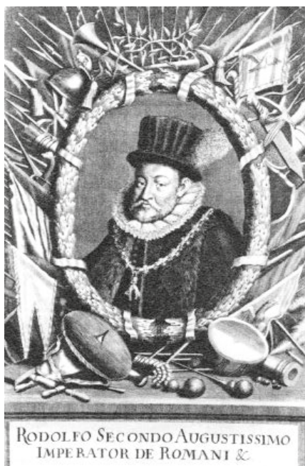
Rudolf II. na mědirytině Jiljího Sadelera

noty bratrské, císařem postavené před sedmi lety mimo zákon. Rudolf, který byl ve vleku katolické strany v čele s kancléřem Zdeňkem Vojtěchem Popelem z Lobkovic, Vilémem Slavatou a Jaroslavem z Martinic, však manévroval, vyhýbal se přímým jednáním, sliboval a zase odvolával. V Praze se zatím dramaticky vyhrcovala situace. Stavý svolaly na 5. květen na Novoměstskou radnici zemský sněm. Císař ho sice zakázal, ale sněm se přece sešel, a Rudolfovi nezbylo, než ho 24. května legalizovat. Odmítl však přistoupit na požadavky nekatolické šlechty požadující náboženskou svobodu. Tím jen přilil oleje do ohně.