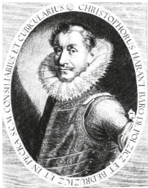
Kryštof Harant z Polžic a Bezdružic na dobové rytině

to vlastně zoufalý chudák, odsouzený bojovat o svou moc. I takové jsou někdy císařské osudy.