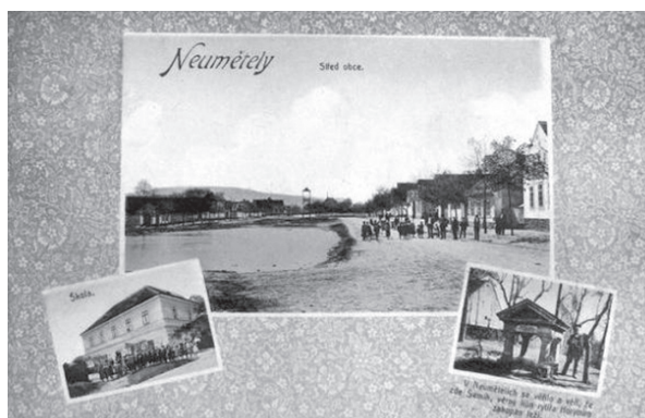
Obec Neumětely na dobové pohlednici. Vpravo dole údajný Šemíkův hrob

fon mohutného vývěru termálních vod. Ať už je to jakkoliv, tenhle zvláštní skalní amfiteátr má v sobě něco fascinujícího.