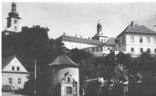
Na snímku z roku 1943 vidíme kostel, kapli i zámek