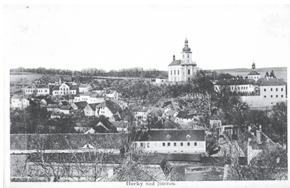
Takhle hezké to v Horkách bývalo...