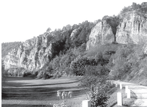
Tajemné kouzlo Kotýzu prochází staletími...

s pohybem měsíce. Patrně zde bývala pravěká a starověká svatyně. Kopec je znám pod mysticky znějícím jménem Zlatý kůň, zdejší zpřístupněné Koněpruské jeskyně jsou oblíbeným turistickým cílem, my ovšem zaměřujeme svoji pozornost na západní část hřebene, dnes téměř oddělenou velkolepými Čertovy schody, který se do něj hladově zakousl z jižního boku. Západní výspa Zlatého koně, směřující k temnotám noci, se nazývá Kotýz.