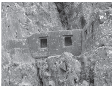
Inkové některé bloky opracovávali přímo ve stěně kamenolomu (Ollantaytambo, 2004)