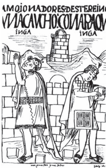
Inkové po sobě zanechali nesčetné ukázky monumentálního stavebnictví

Velká říše Inků, mocné impérium Tawantinsuyu , byla největší říší v Americe a jednou z největších na světě. V době svého největšího rozkvětu zahrnovala obrovské území Jižní Ameriky, od Kolumbie a Ekvádoru na severu přes Peru až do Bolívie, Chile a části Argentiny na jihu. Celková populace dle odhadů dosahovala 12 milionů obyvatel. Jejich sjednocujícím prvkem byl jazyk kečua, který je dodnes mezi andskými