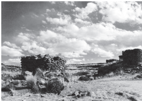
Trosky chulpas, pohřebních věží v Sillustani, poblíž města Puno

Existují dosud pochybnosti či nejasnosti, jakým způsobem opracovávali či umísťovali kameny nebo bloky do svých staveb s takovou neomylnou přesností. Co se týče malých kamenů či bloků, byla práce jistě snadnější, neboť je mohli zasazovat, vytahovat a znovu upravovat. V případě několikatunových megabloků to ovšem bylo složitější a těžko by si s tím poradila i dnešní vyspělá stavební technika. Obří kamenné bloky jsou precizně opracované do