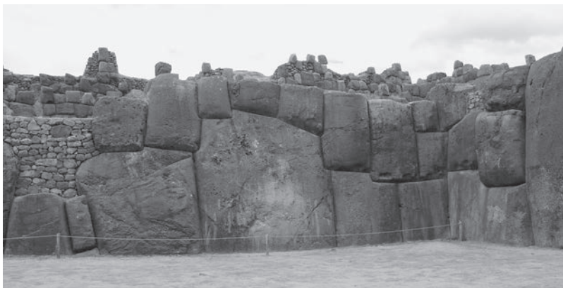
Obří kamenné bloky na lokalitě Sacsayhuaman v blízkosti Cusca

že fáze Inků znamená ve vývoji prehispanických civilizací jen krátkou epizodu, charakterizovanou zejména rychlou a výkonnou vojenskou expanzí, která korunovala významným způsobem předchozí snahy o sjednocení říše. Inkové nebyli první, kdo budovali megalitické stavby. Působivé ukázky kamenné architektury vznikaly o mnoho století dříve v Tiahuanaku, na březích jezera Titicaca, a ještě po příchodu Španělů nejlepší kameníci pocházeli právě z této oblasti Altiplana. Nepopíratelné znalosti andských indiánů v architektuře, stavebnictví a v práci s kamenem všeobecně jsou tedy bezesporu produktem dlouhodobého, dá se říci několikatatisíciletého vývoje, jehož výsledkem bylo vytvoření jedné z nejpokročilejších civilizací, a to bez zásahu nebo vlivu jiných kultur.