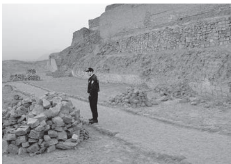
Pachacamac byl vybudován z nepálených cihel adobe

Ale samozřejmě i kvádry jednodušších tvarů a menších hmotností vynikají svou precizností. Při stavbě paláců a chrámů se používaly kamenné bloky uspořádané do perfektních horizontálních linií s hladkým,