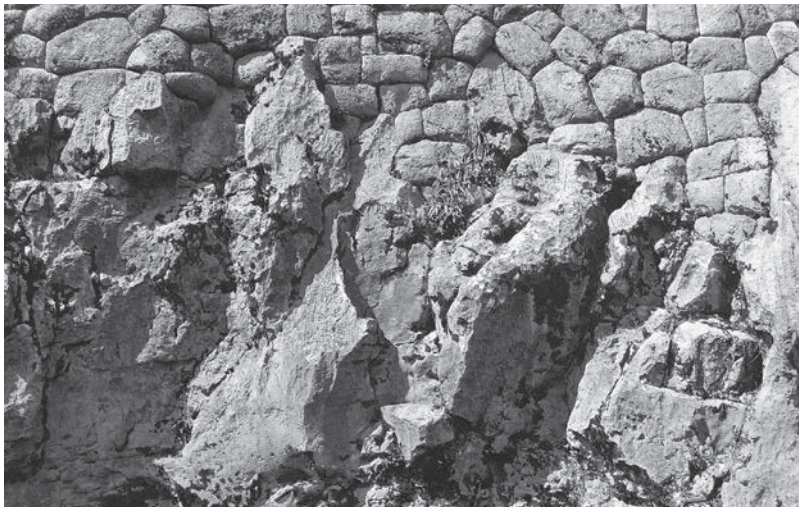
Perfektní vazba rustického stylu stavby na skalní podloží

na pobřeží, vybudovaných převážně z adobe, je město Pachacamac jižně od Limy.