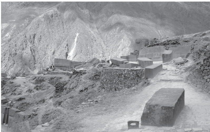
Opracované bloky připravené k zasazení na Ollantaytambo

indiány výrazně převažujícím jazykem a v Peru byl vyhlášen v roce 1975 za jazyk státní vedle španělštiny. Panovník říše byl označován jako inka, syn Slunce, a všichni věřili v jeho božský původ. Měl proto nikým neomezenou moc a absolutní respekt. Hlavním městem říše bylo město Cusco, považované za „pupek světa“, neboť Inkové věřili, že nikde jinde na světě neexistuje jiná vyspělá kultura. Byl to tedy národ dominantní, s perfektní organizací státní správy rozdělené do tříd, se vzdělanými a zkušenými inženýry a architekty. Říše se začala formovat někdy během čtrnáctého století a její zánik se klade do roku 1530, kdy byla poražena španělskými dobyvateli. Při této sociální organizaci, znalostech a zkušenostech, vycházejících z tisícileté historie předchozích kultur, je podivné a nepochopitelné, že Inkové neznali písmo. Snad uměli číst z různobarevných a různě dlouhých provázků označovaných jako uzlové písmo kipu („quipus“), ale to spíše sloužilo pro záznam množství úrody či pro vojenské účely. Možná si byli vědomi tohoto nedostatku, a proto zaznamenávali různé významné události, ale i zcela obyčejné věci svými kresbami či rytinami na kamenech, kamenných blocích či celých skalních stěnách.