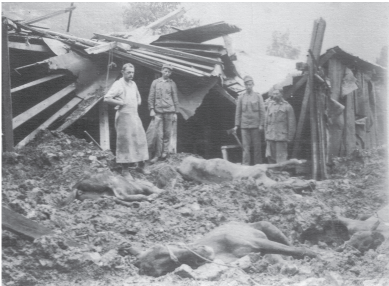
Umírali dvou- i čtyřnozí...

Na západní frontě byly vybudovány zákopy, betonové bunkry a minová pole. Postup jen o několik set metrů znamenal obrovské ztráty na lidských životech. Rakouský konflikt se Srbskem najednou ustoupil do pozadí, na jižní frontě byl až do podzimu 1915 víceméně klid, protože Srbsku se podařilo s francouzskou pomocí vytlačit nepřítele ze země, situaci zvrátil až vstup Bulharska do války na straně Ústřed-