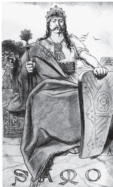
Kníže Sámó v představě Mikoláše Alše

záležitosti a dohodu. Přece jen mu záleželo na dobré pověsti své říše. Namyšlený Dagobertův vyjednaváč Sicharius ale jiné urovnání než tučnou náhradu odmítl se slovy, že „není možno, aby křesťané a sluhové boží mohli uzavřít přátelství se psy“. To byla od něj pořádná drzost a Sámó rázem zapomněl, že je původem také Frank. Jménem všech Slovanů se urazil a vmetl Dagobertovu vyslanci do očí velmi ostrá slova, která si tento za rámeček jistě nedal: „Jestliže vy jste sluhové boží a my jsme boží psi, tu když vy ustavičně proti němu jednáte, nám je dovoleno trhat vás svými