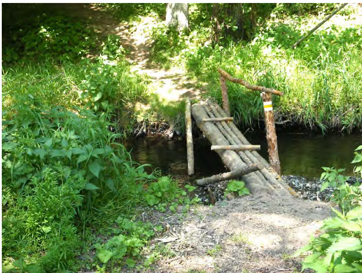
Lávka přes Kocábu

Na rozcestí se dáme společně se žlutou po silničce vlevo a zvolna pohodlně klesáme zpět k údolí. Vyjdeme na rozlehlou louku, kde nás značky nasměrují vlevo až na dno údolí. Po chatrné dřevěné lávce tu přejdeme potok.