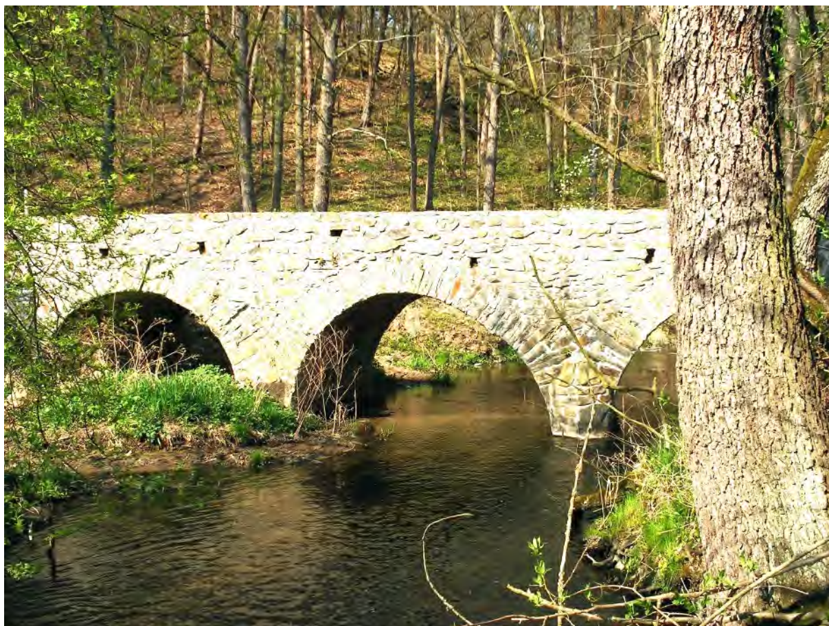
Kamenný most přes Kocábu

Na rozcestí se dáme vlevo. Naše značení tu opustí žlutá a místo ní se k nám přidá modrá, která s námi půjde až do cíle. Kamenitou silničkou klesáme zpět do utěšeného údolí Kocáby. Musíme ji znovu přejít. Tentokrát nás však čeká bytelný kamenný a nedávno opravený můstek. Za ním se cesta zlomí vlevo a pokračuje dále okrajem malebného údolí s meandry potoka. Objevíme tady i značení cyklotrasy.