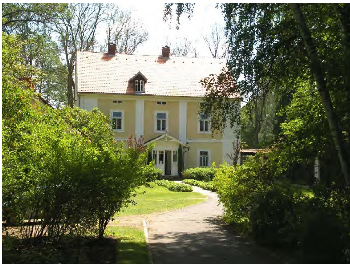
Památník Karla Čapka na Strži

Po prohlídce Čapkova památníku se vrátíme na hráz. Tam si všimneme místního značení v podobě úhlopříčně děleného červenobílého čtverce, kterým je značena okružní cesta Karla Čapka. Toto značení, kterému se turisticky říká „psaníčko“, se k nám nenápadně přidalo už za parkovištěm a bude nás provázet celý zbytek cesty. Vydáme se dále po hrázi, ale u jejího konce odbočíme vlevo podle zdi. Naši značku tu doprovází ještě zelená. Na konci zdi objevíme malou branku, kterou se dá vstoupit do zadní části zahrady na Strži.