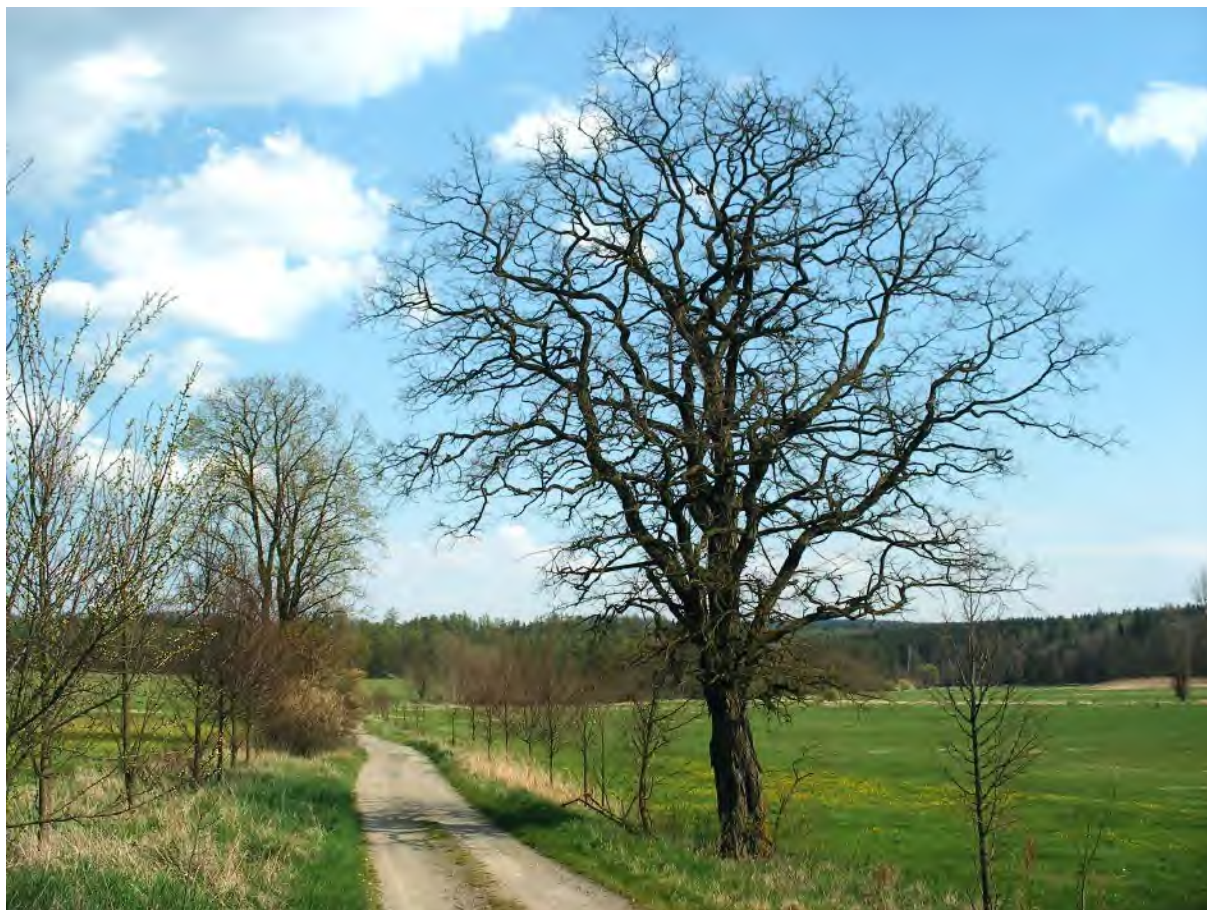
Cesta v lukách u Strže

V brzké budoucnosti je plánována změna okružní cesty Karla Čapka na naučnou stezku s informačními panely. Pokud k tomu dojde, jistě se výrazně zlepší i značení okruhu.