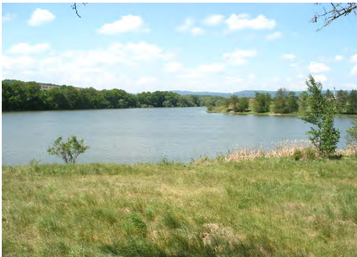
Pohled na rybník Strž

Na silničku po břehu rybníka je zakázán vjezd, vyjdeme tedy po červené a zelené značce, které právě tady začínají. Zanedlouho se přiblížíme k hrázi, u jejíhož začátku je přepad, kterým z rybníka vytéká potok. Vlevo nad výpustí se tyčí skalnaté návrší, na němž vidíme štíhlý hranolový kamenný sloup. Je od něj hezký pohled na rybník a zakrátko se k němu ve vyprávění vrátíme. Stačí ještě několik kroků po cestě a stojíme před brankou. Za zdí se tu pod hrází ukrývá prostý patrový domek, v němž je nyní expozice Památníku Karla Čapka.