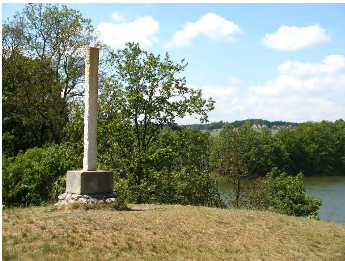
Čapkovo oblíbené místo s pomníkem na skále nad rybníkem