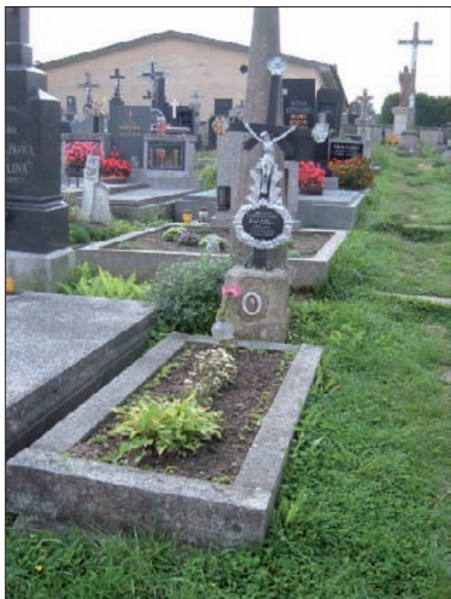
Deštná – Dittersův hrob

tersdorfu (1739–1799). Tradiční provaznictví připomíná muzeum z r. 1998. Letecké muzeum z r. 2008.