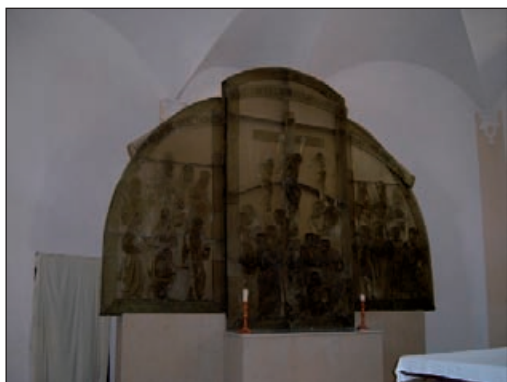
Dobrá Voda – skleněný oltář