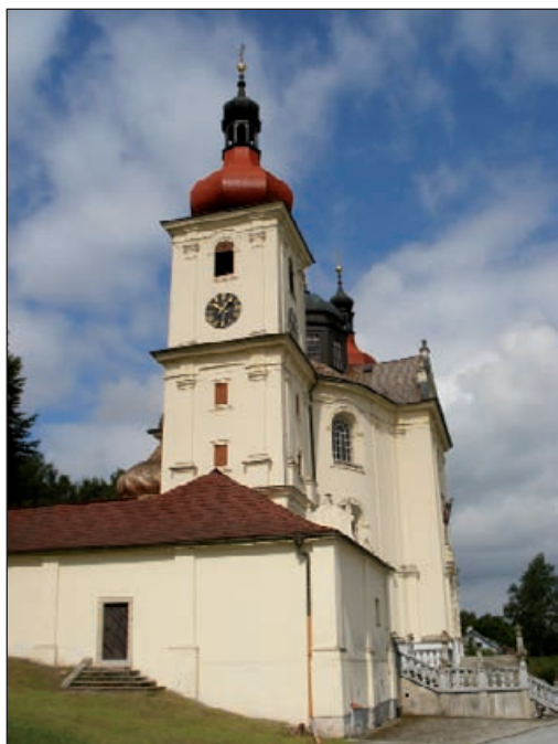
Dobrá Voda u Nových Hradů