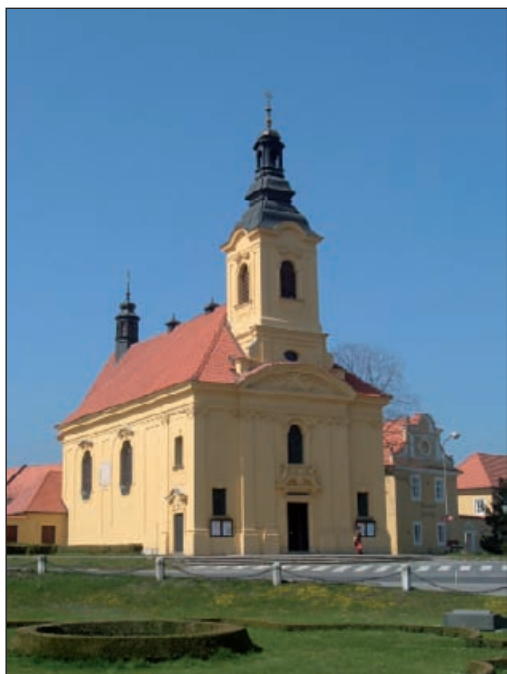
Dobříš – kostel

místě barokní stavby z r. 1742, která se r. 1888 zřítla. V okolí mnoho pomníků obětem války r. 1866.