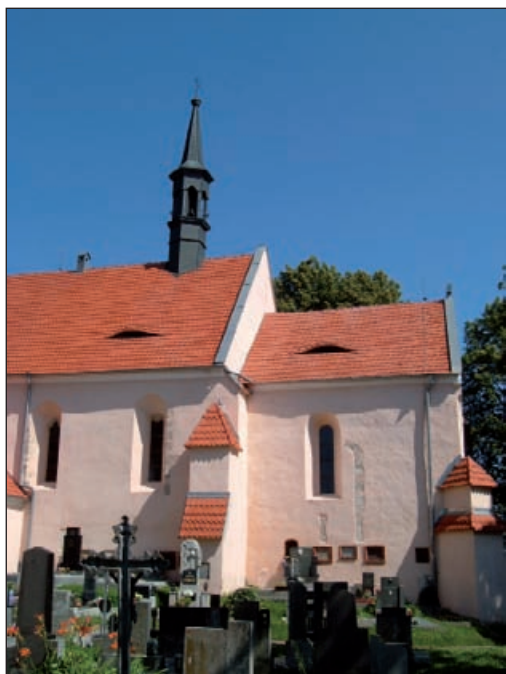
Čížová – kostel