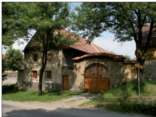
Dobrovíz – statek

Obec prvně zmíněna r. 1238, archeologické nálezy dokládají již keltské i slovanské osídlení, od r. 1995 památková zóna. Historické jádro středověkého původu tvořeno hodnotným souborem lidové architektury, pozdně barokní a empírové usedlosti z let 1800–1850. Barokní kaple Panny Marie z 2. třetiny 18. stol. Při silnici na Jeneč evangelický toleranční hřbitov z r. 1781. Směrem k Bělokům skála s výhledem na Kladno a býv. Žákův mlýn. V obci natáčena filmová pohádka Tři veteráni.