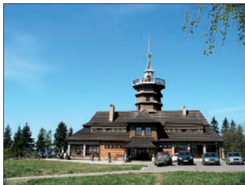
Dobrošov – Jiráskova chata

Ves na stejnojmenném vrchu (622 m n. m.) prvně uváděna r. 1415, nyní část města Náchod. Kaple sv. Antonína Paduánského z r. 1935. Na vrcholu západně turistická Jiráskova chata z let 1912–1914, vystavěna podle návrhu Dušana Jurkoviče a převážně krytá šindelem, přestavěna v letech 1921–1923, v restituci vrácena r. 1995 Klubu českých turistů, po rekonstrukci otevřena r. 2002. Součástí chaty 24 m vysoká rozhledna z r. 1923 s vyhlídkovým ochozem ve výši 16 m. Západně dělostřelecká tvrz Dobrošov a nedokončená soustava opevnění z let 1936–1938 s výstavní síní, zpřístupněno r. 1969. Naučná stezka.