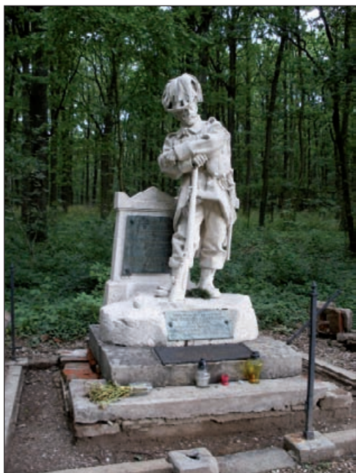
Čistěves – pomník rakouského myslivce

rodil významný barokní litoměřický architekt Ottavio Broglio (1670–1742).