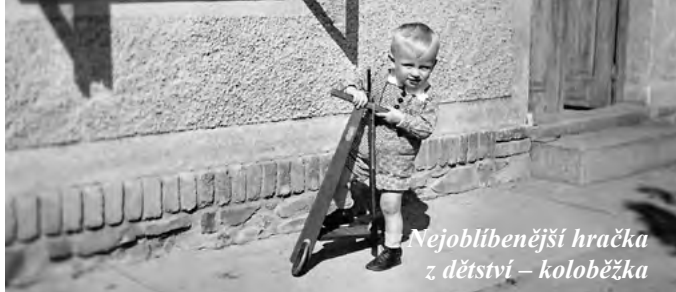
Nejoblíbenější hračka z dětství – koloběžka

se oklikou do vesnice Kočvary. A ještě ten večer k nám přiběhl jeden kluk z Kočvar a křičel: