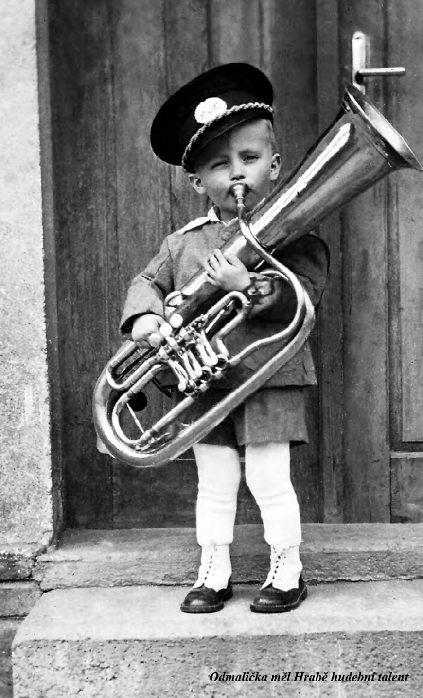
Odmalička měl Hrabě hudební talent