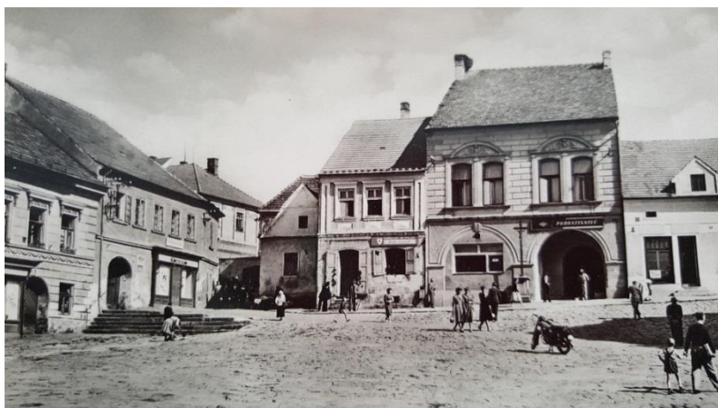
Trhové Sviny mého mládí

Na štěstí se tatínek do roka vrátil živý a zdravý zpět do nově vzniklé Československé republiky. Ve škole se obrazy císaře Karla vyměnily za portrét našeho prvního prezidenta Tomáše Garrigua Masaryka.