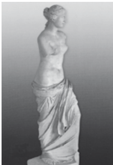
Obr. 1. Afrodita, Kypr. Afrodita je starověká bohyně lásky a krásy z řecké mytologie. V římské mytologii měla latinský ekvivalent Venuše. Byla jednou z nejmocnějších bohyň. Je symbolem ženskosti, tak se objevuje i v nejstarších archeologických památkách.

V době starého Řecka se mění ideál ženy – už jím nebyla kyprá žena. Řekové hledali krásu a tu našli ve štíhlosti egyptských tanečnic. Stíraly se rozdíl mezi muži a ženami, preferovány byly asexuální typy. Ideál krásy vycházel více z oblasti duchovní než tělesné. U některých uměleckých děl té doby je